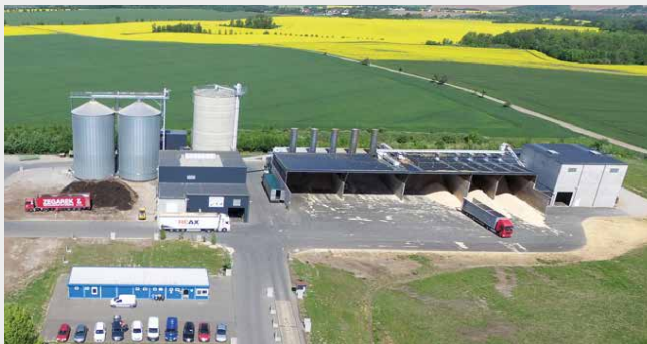
Die Raiffeisen Bio-Brennstoffe GmbH vermarktet nun exklusiv die Jahrestonnage von 60.000 Tonnen, die die Danpower Pelletproduktion GmbH in Heidegrund/Sachsen-Anhalt herstellt.