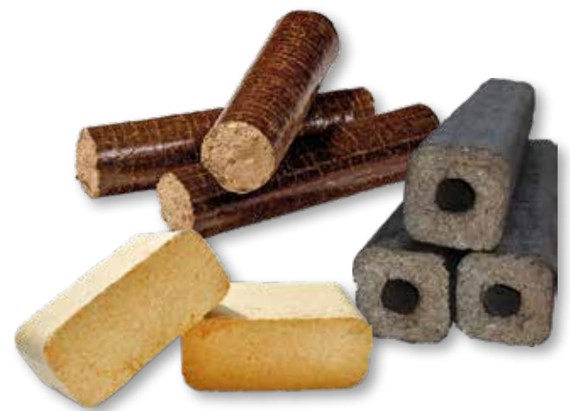
Die RBrik-Produkte gibt es als Weich- und Hartholzvarianten. Vertriebspartner sind die regionalen Raiffeisen-Genossenschaften.

Die RBrik-Produkte gibt es als Weichholz- und Hartholzvarianten. Die regionalen Raiffeisen-Genossenschaften sind auch bei den RBrik-Produkten ein verlässlicher Partner und garantieren durch ihre Raiffeisen-Märkte eine kundennahe Infrastruktur. Weitere Informationen unter www.rpellets.de