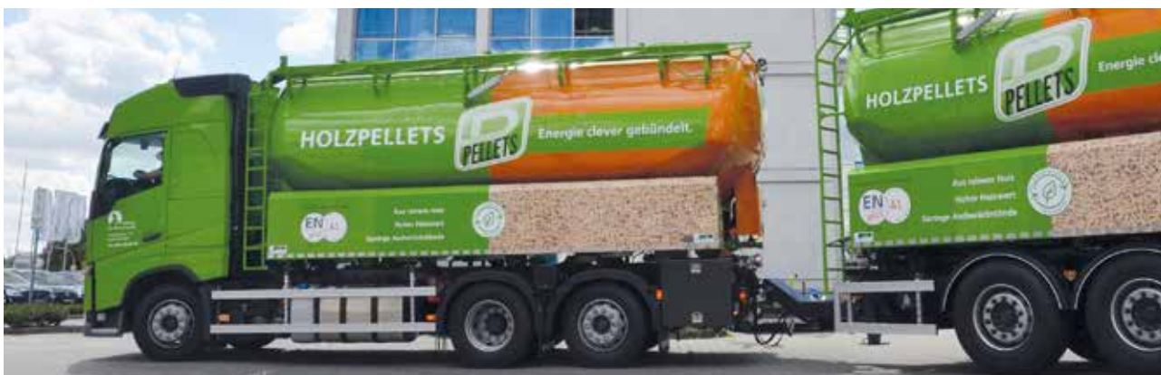
Ebenso leistungsstark wie wendig, sodass auch Kunden in engen Wohnstraßen erreicht werden können: der neue Silozug der Raiffeisen Bio-Brennstoffe GmbH.